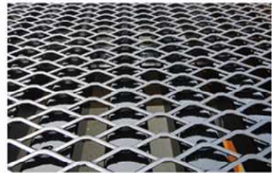
エキスパンドメタル